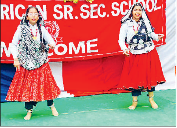
झज्जर। नव वर्ष के उपलक्ष्य में सांस्कृतिक कार्यक्रम की प्रस्तुति देते हुए छात्राएं।