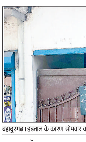
बहादुरगढ़। हड़ताल के कारण सोमवार को बंद रहे राशन डिपो।

बहादुरगढ़ में लगभग 53 हजार बीपीएल कार्ड और पौने 1500 बीपीएल कार्ड हैं। इनके जरिये दो लाख से अधिक लोग रजिस्टर्ड हैं। सरकार की योजना के अनुसार, इन्हें अनाज मिलता है। एक से लेकर 15 तारीख तक राशन वितरण किया जाता है।