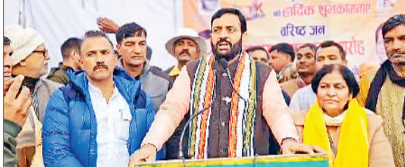
झज्जर। कार्यक्रम के दौरान उपस्थित लोगों को संबोधित करते हुए भाजपा प्रदेशाध्यक्ष नायब सैनी।

भाजपा प्रदेशाध्यक्ष नायब सैनी ने कहा है कि कांग्रेस का न तो संवैधानिक संस्थाओं पर और न ही न्यायालय पर विश्वास रहा है। यहीं वजह है कि कांग्रेस के दिग्गज नेता संवैधानिक पदों पर बैठे लोगों का भी अपमान करने से नहीं चूकते हैं। उनका इशारा उपराष्ट्रपति की पिछले दिनों टीएमसी सांसद द्वारा मिमिक्री करने और राहुल गांधी द्वारा उसका वीडियो बनाने की तरफ था। नायब सैनी सोमवार को कस्बा बेरी में आयोजित एक कार्यक्रम में भाग लेने उपरांत मीडिया से बातचीत कर रहे थे।