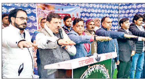
हरिभूमि न्यूज़ ▶▶ बहादुरगढ़

विकसित भारत संकल्प यात्रा जनसंवाद कार्यक्रमों में जहां पात्र लाभार्थियों को मौके पर ही सरकार की योजनाओं का लाभ मिल रहा है, वहीं आम नागरिक भी बढ़-चढ़ कर सरकार की जनकल्याणकारी योजनाओं की जानकारी ले रहे हैं। सोमवार को गांव आसोदा सिवान और आसोदा टोडरान के अलावा शहर के भगत सिंह पार्क और राव तुला राम पार्क में विकसित भारत संकल्प यात्रा पहुंची।