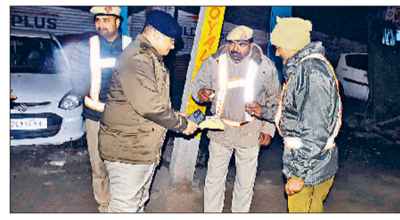
वहनों पर लगाए रिफ्लेक्टिव टेप