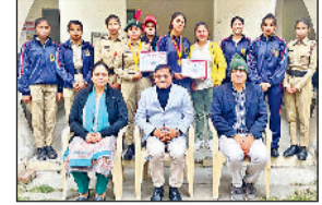
झज्जर। एनसीसी कैडेट्स महाविद्यालय स्टाफ सदस्यों के साथ।