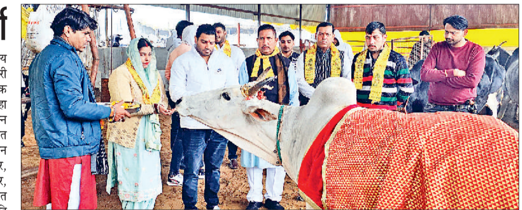
बहादुरगढ़। गोमाता की सेवा करते कौशिक परिवार के सदस्य।