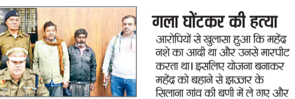
बहादुरगढ़। पुलिस की गिरफ्त में दोनों हत्यारोपी।