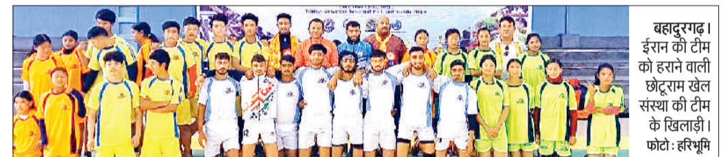
बहादुरगढ़। ईरान की टीम को हराते वाली छोट्टाराम खेल संस्था की टीम के खिलाड़ी।

अंतरराष्ट्रीय स्तर पर लगातार ट्राफी जीतने वाली ईरान की टीम को बुल्लड अखाड़े की टीम ने फाइनल में हुए कौट के मुकाबले में 3 अंकों से परास्त किया। बुल्लड पहलवान के अनुसार राष्ट्रीय किसान नेता राकेश टिकैत ने भी जीतकर लौट रहे खिलाड़ियों को शहरानपुर में ट्रेन से उतारकर अभिनंदन किया।